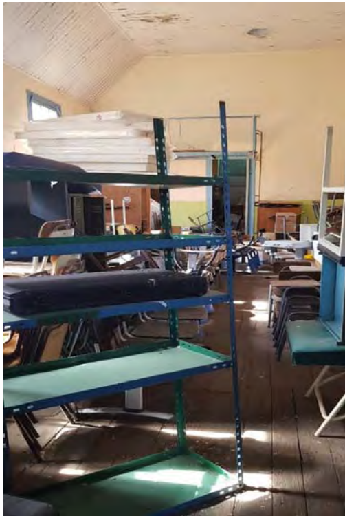
Fotografía N° 3