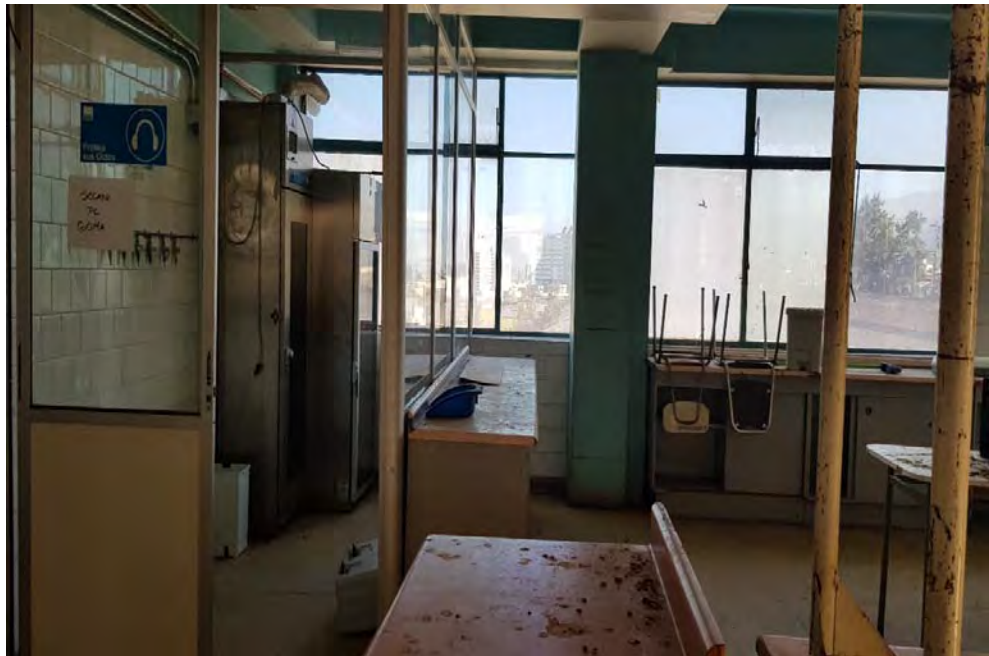
Fotografía N° 5