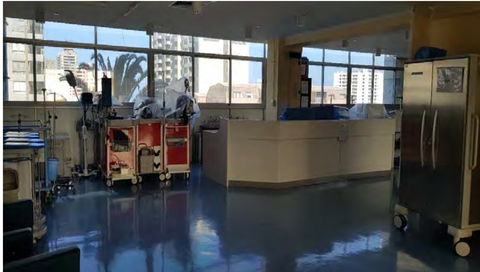
Fotografía N° 1